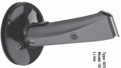
Type 1870 Li+ Model 1870 Li+ Li-Ion

(en) Opening Instructions Corti/Cortises Hair Clipper (es) Instrucciones de uso Máquina de corte de pelo con alimentación de red / por batería